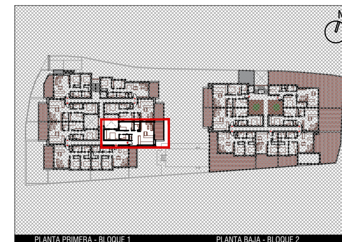
PLANTA PRIMERA - BLOQUE 1