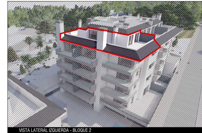
VISTA LATERAL IZQUIERDA - BLOQUE 2