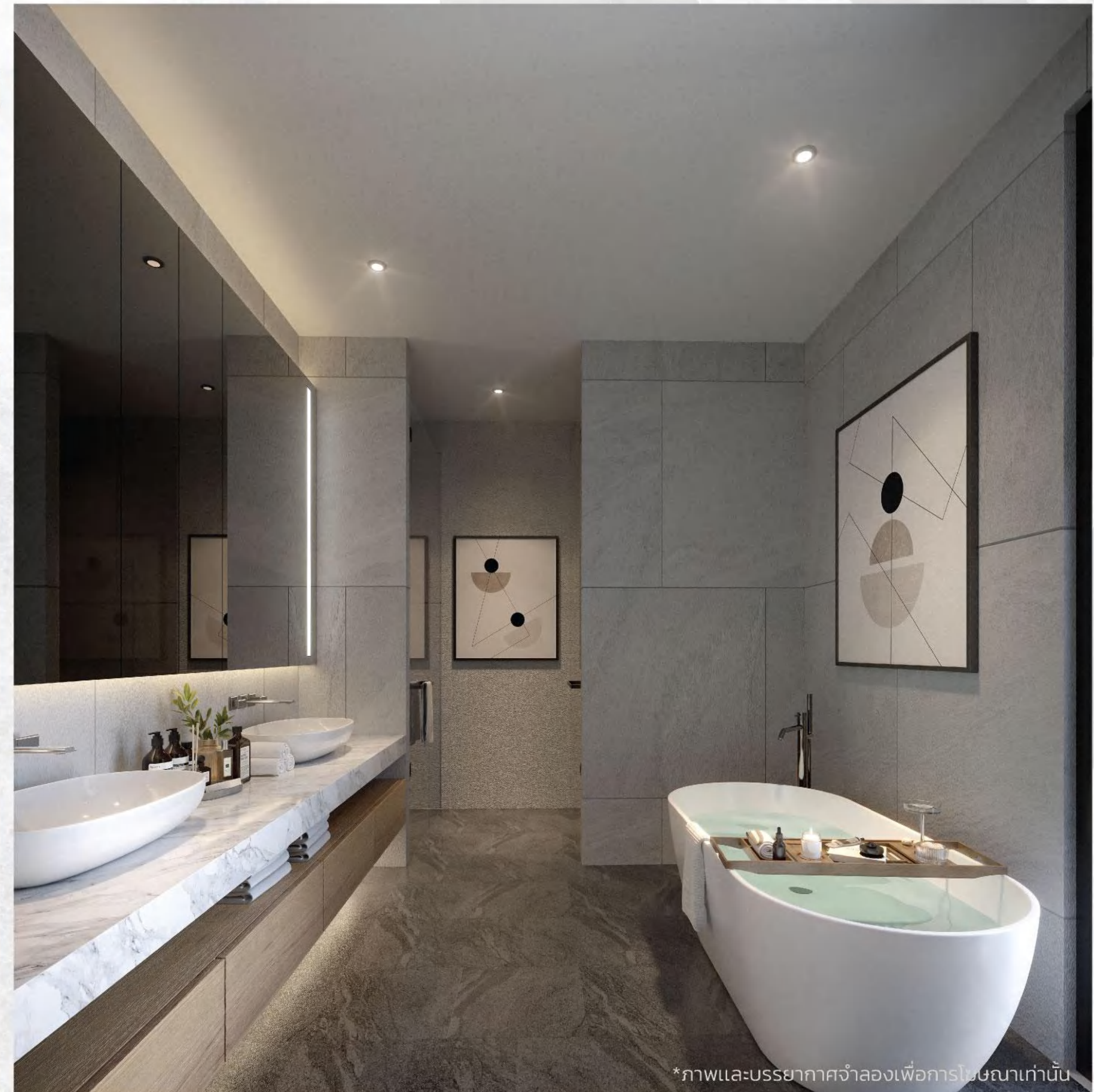
*ภาพและบรรยากาศจำลองเพื่อการโฆษณาเท่านั้น