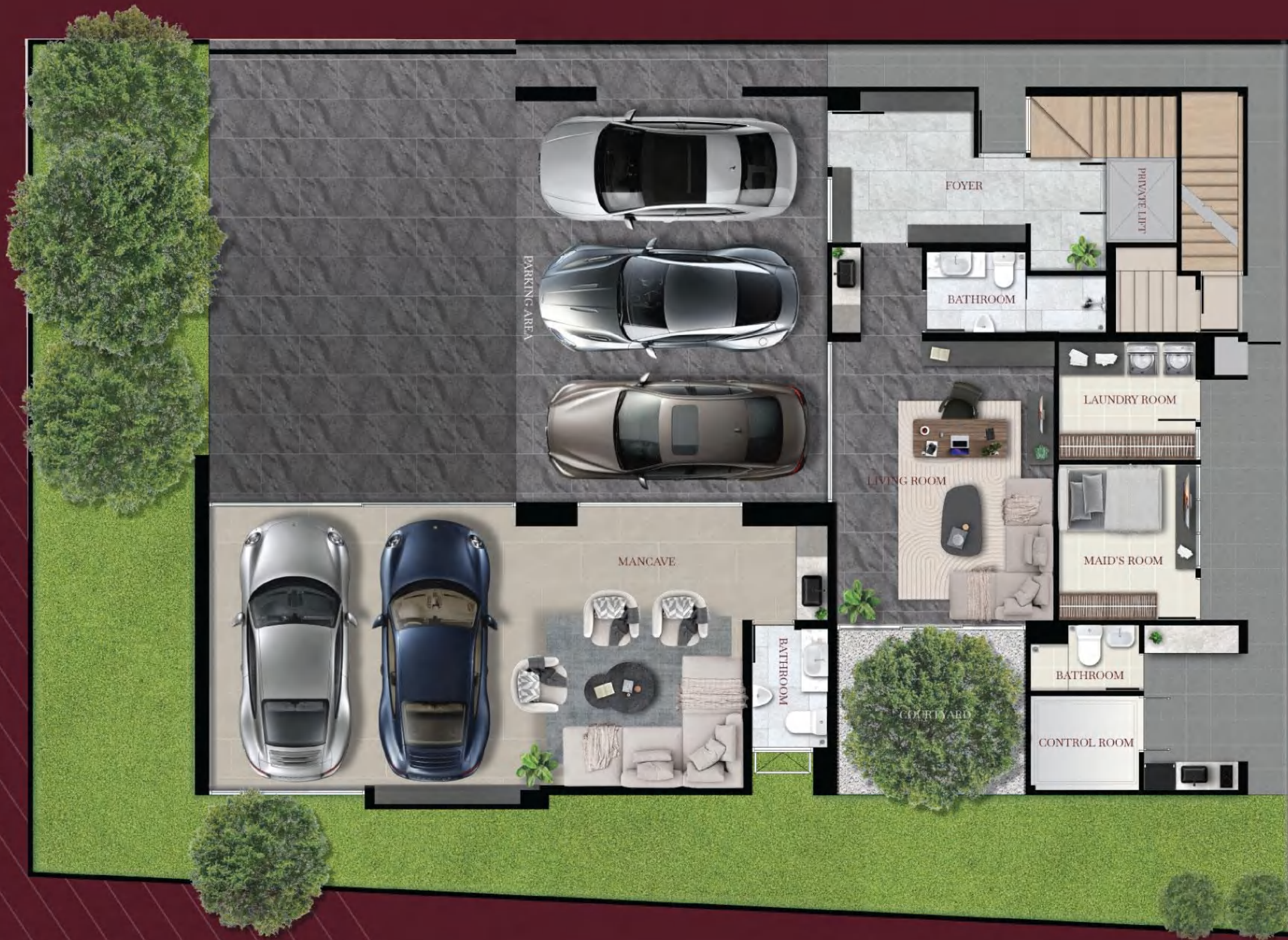
1 st floor