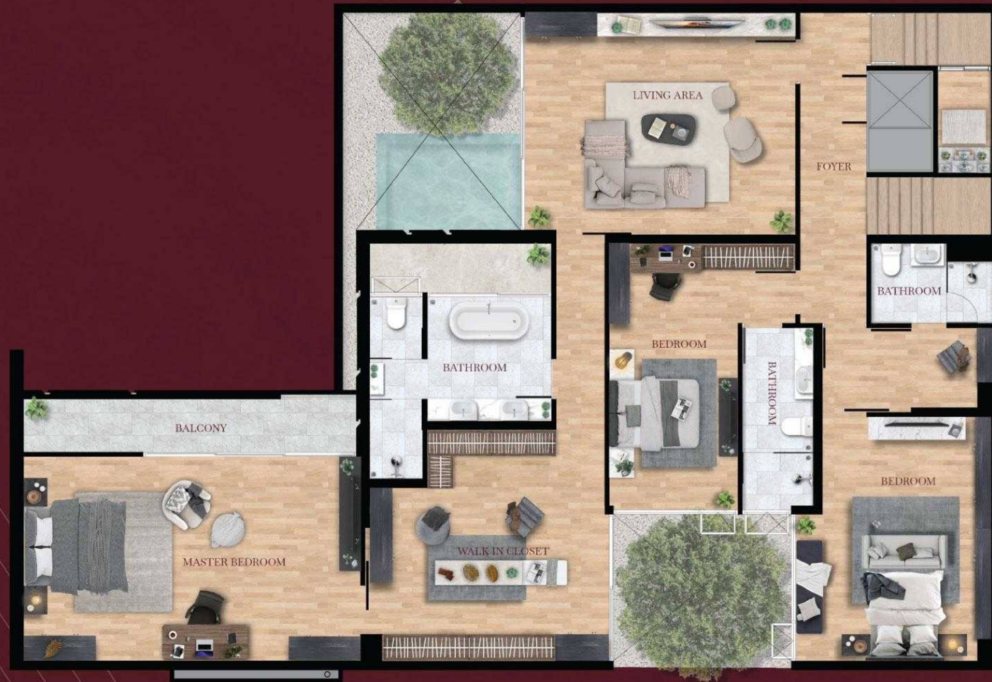
3 rd floor