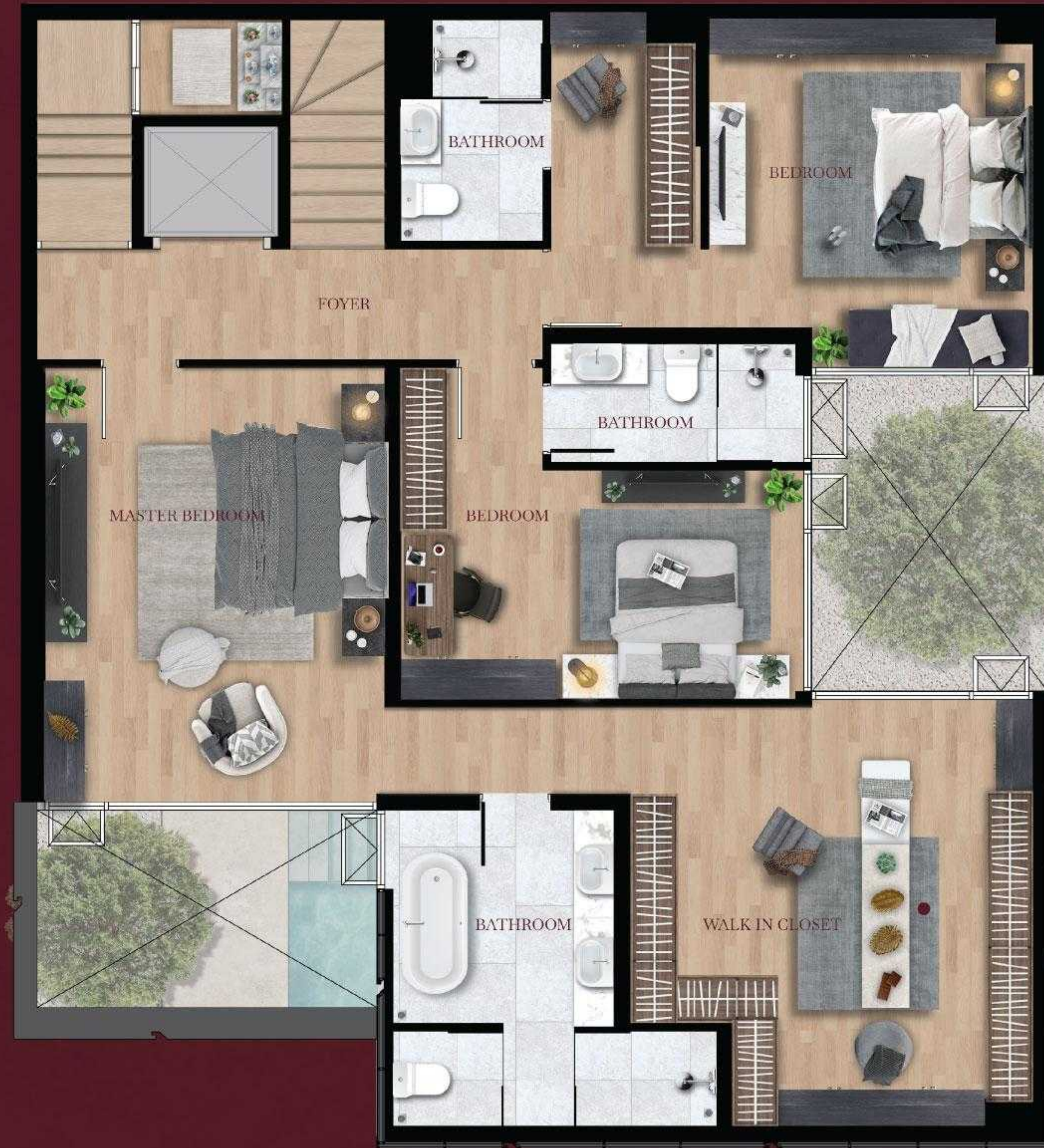
3 rd floor