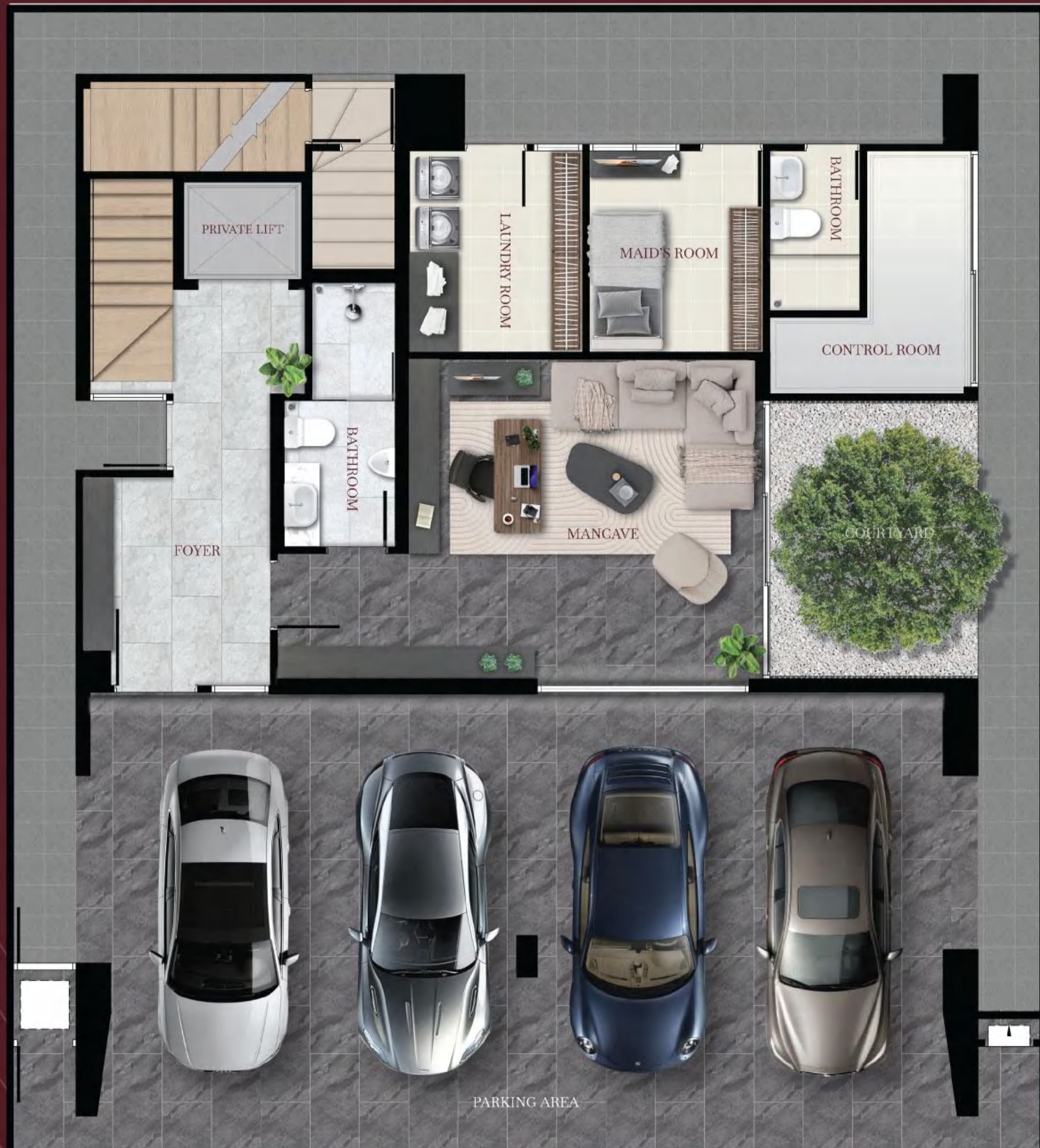
1 st floor