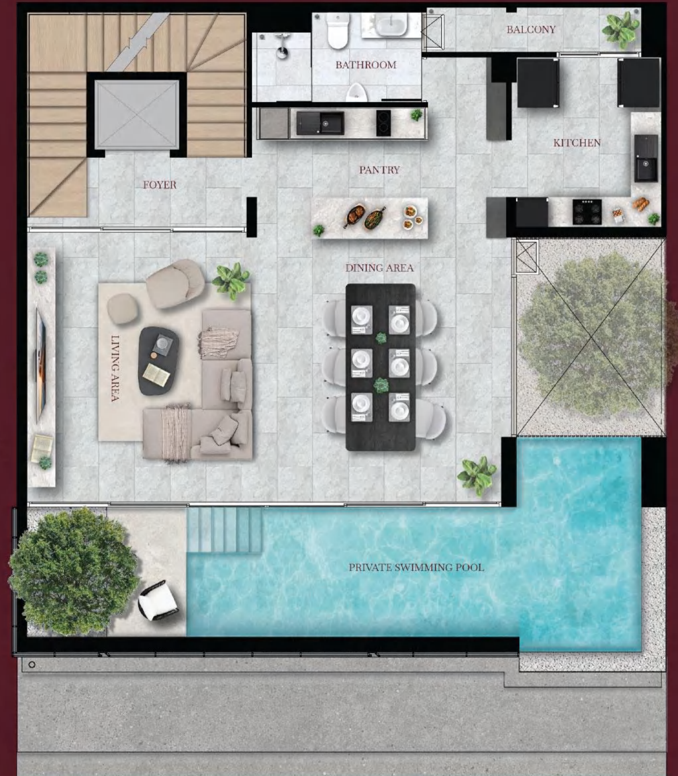
2 nd floor