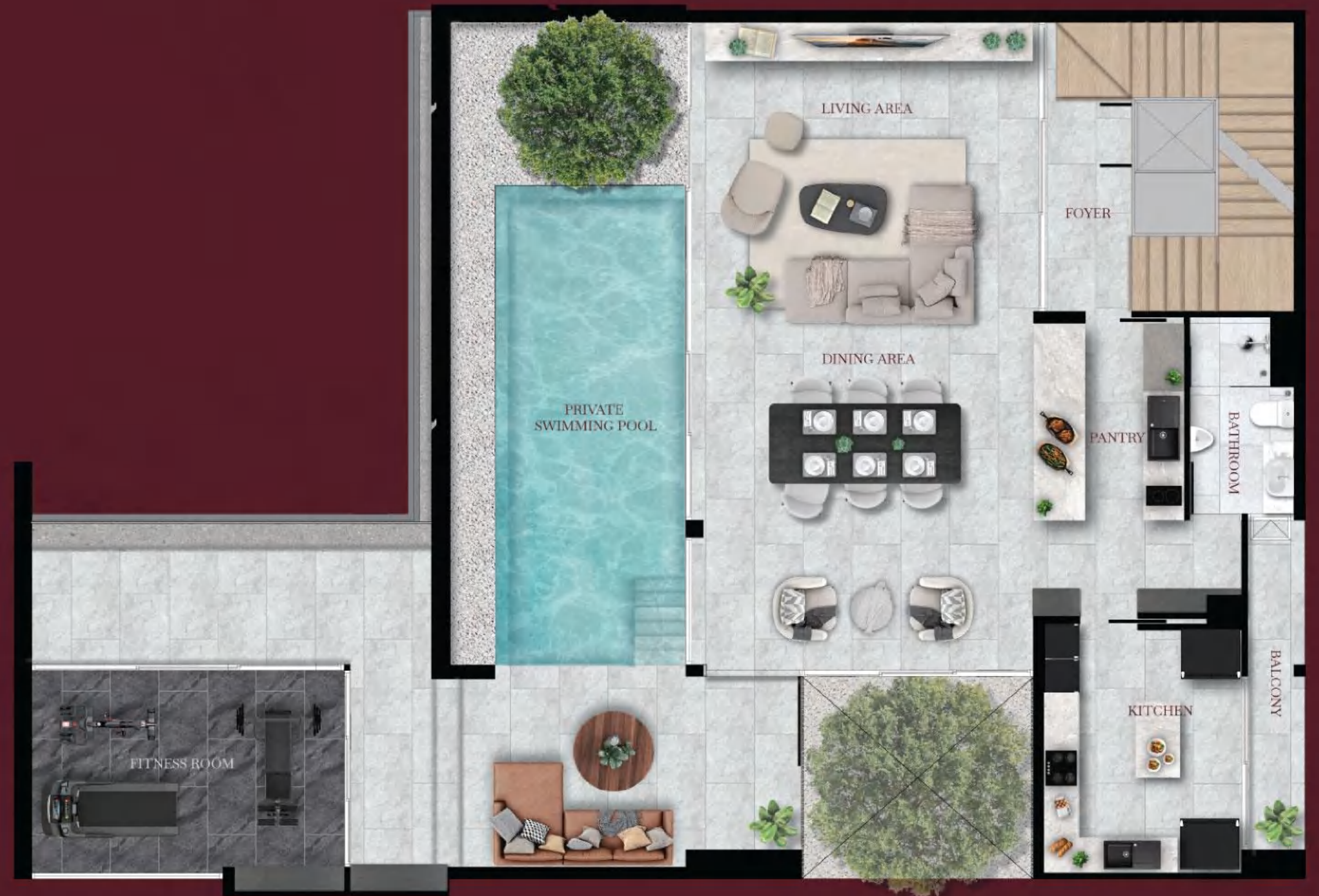
2 nd floor