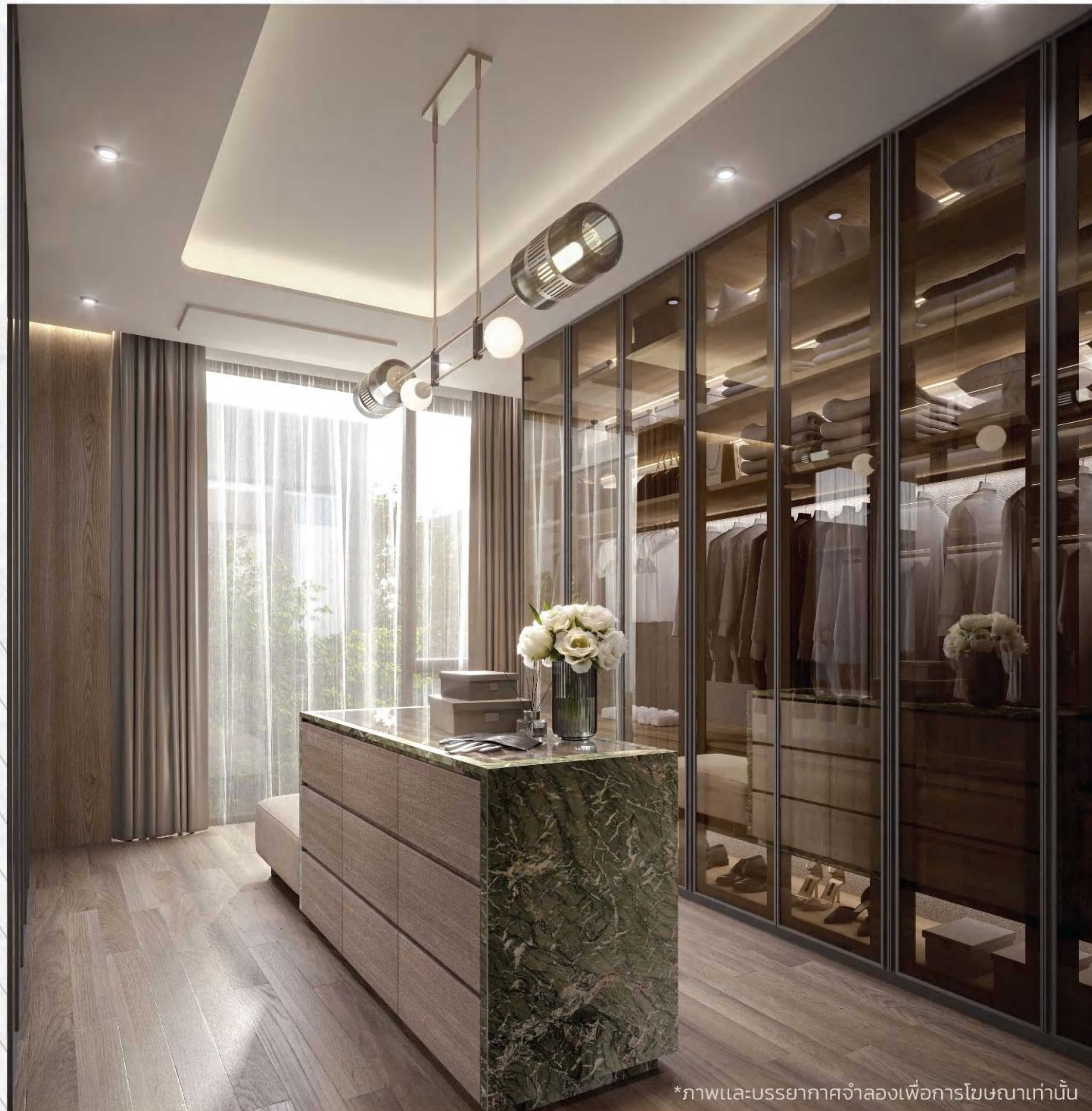
*ภาพและบรรยากาศจำลองเพื่อการโฆษณาเท่านั้น